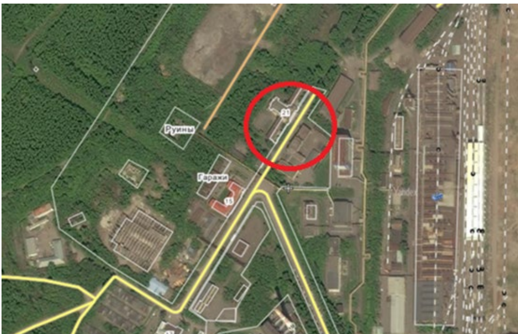
Ил. 3. Ситуационная схема расположения гостиницы в Верхней колонии Fg. 3. Situational diagram of the hotel of the Verkhnyaya Koloniya location

После сноса жилья на Верхней колонии бывшая гостиница, оказавшаяся в санитарно-защитной зоне теперь уже Новокузнецкого металлургического комбината, использовалась как заводское административное здание, с конца 1990-х по 2018 г. часть помещений арендовалась частными организациями. В настоящее время общее состояние объекта можно оценить как крайне неудовлетворительное, здание гостиницы нуждается в срочной реконструкции и архитектурной реновации. При визуальном обследовании были выявлены многочисленные очаги деформации и выпучивания напольного покрытия цокольного этажа и подвальных помещений, причиной которых может являться осадка (подвижка) фундаментов вследствие смещения грунта. Для выяснения состояния фундаментов необходимо их конструктивное обследование.