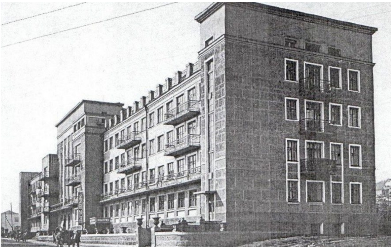
Ил. 1. Гостиница на Верхней колонии, г. Новокузнецк, 1936 г.

Выбирая для соцгорода строчную застройку, архитектор учитывал положение