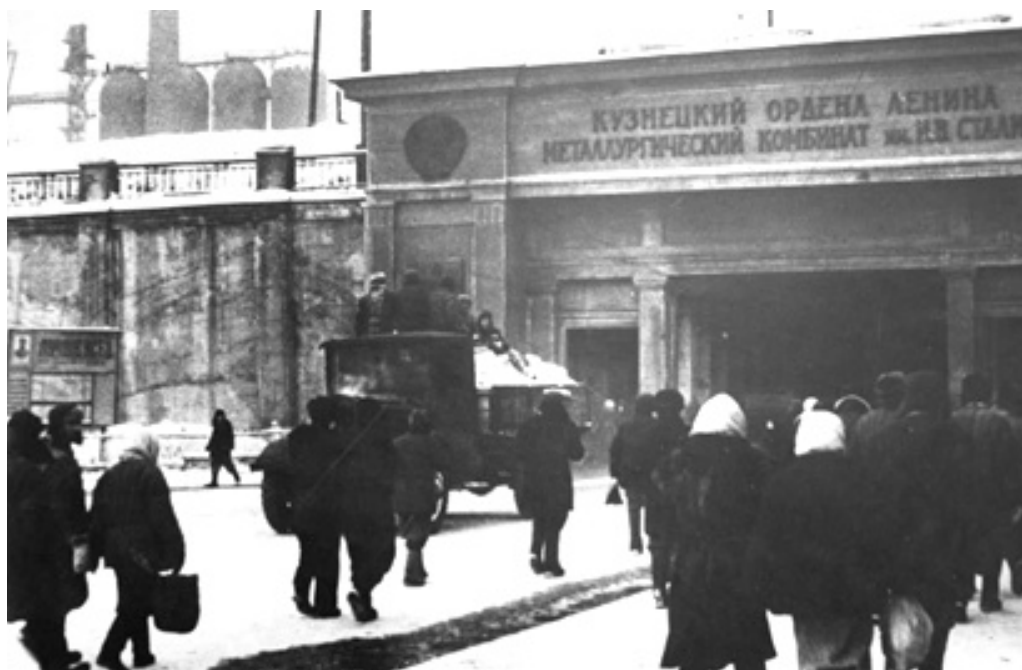
Ил. 2. Вход в тоннель Кузнецкого металлургического комбината, г. Новокузнецк, 1943 г. Снимок из личного архива Н.А. Бровкина

В Верхней колонии были построены школа, поликлиника, столовая, баня, пожарное депо, городской сад отдыха, общежитие и гостиница завода с рестораном и кинозалом. Главная улица жилого поселка — Тельбесская — была асфальтирована одной из первых в городе. В 1936 г. на Верхней колонии возвели одно из первых капитальных зданий — новокузнецкую гостиницу в стиле конструктивизм (ил. 1), главными архитекторами которой в разное время были И.А. Голосов, А.Г. Капустина и А.Д. Крячков. Позже во внешний облик здания были добавлены неоклассические элементы [Чередниченко, 2018, с. 602]. В гостинице разме-