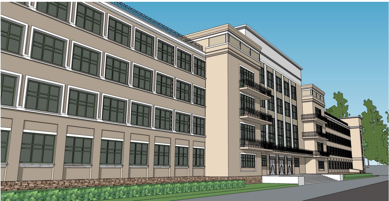
Ил. 5. Визуализация здания гостиницы Верхней колонии в г. Новокузнецке. Выполнено Е.А. Арыковой Fg. 5. Visualization of the hotel of the Verkhnyaya Koloniya in Novokuznetsk. Made by E. A. Arykova

Далее маршрут пройдет к мемориальному комплексу бывшего Сада металлургов. Между ними будут размещены парковые зоны с выставочными площадками и ин-